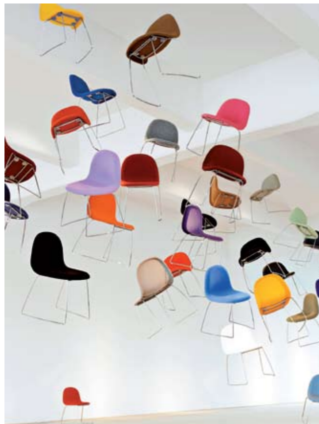
BEROEMD DEENS DESIGN: GUBI CHAIRS